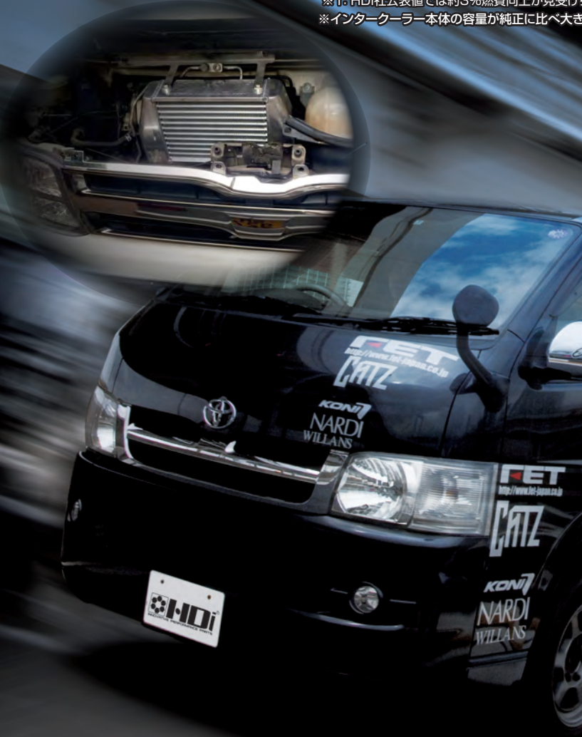
HDi GT2 TOYOTA HIACE 200 INTERCOOLER KIT

※インタークーラー本体の容量が純正に比べ大きい為、純正のインタークーラーに装着されている導風カバーは装着できなくなります。